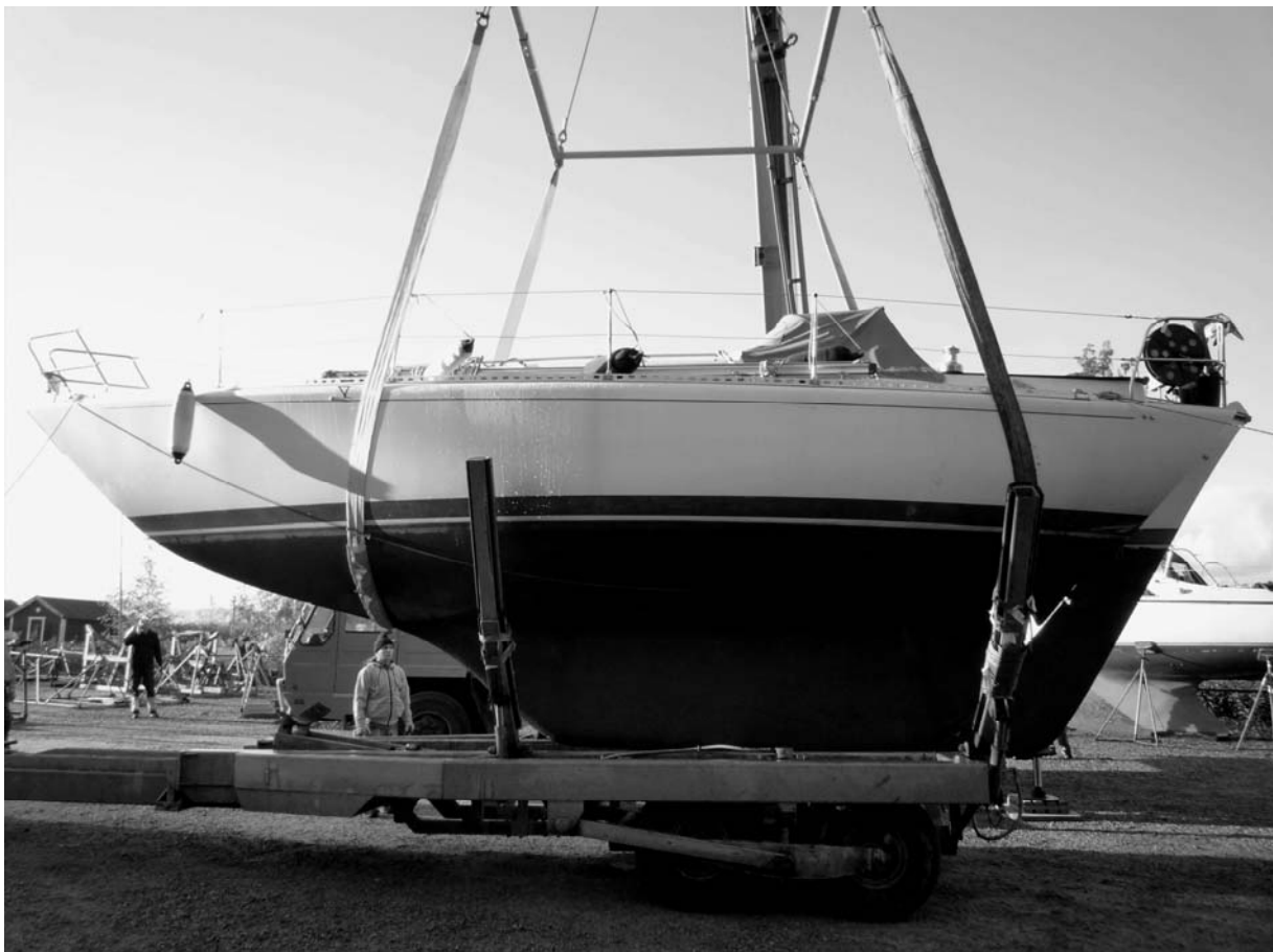
Metodiskt landas båt efter båt på land för vintervila.