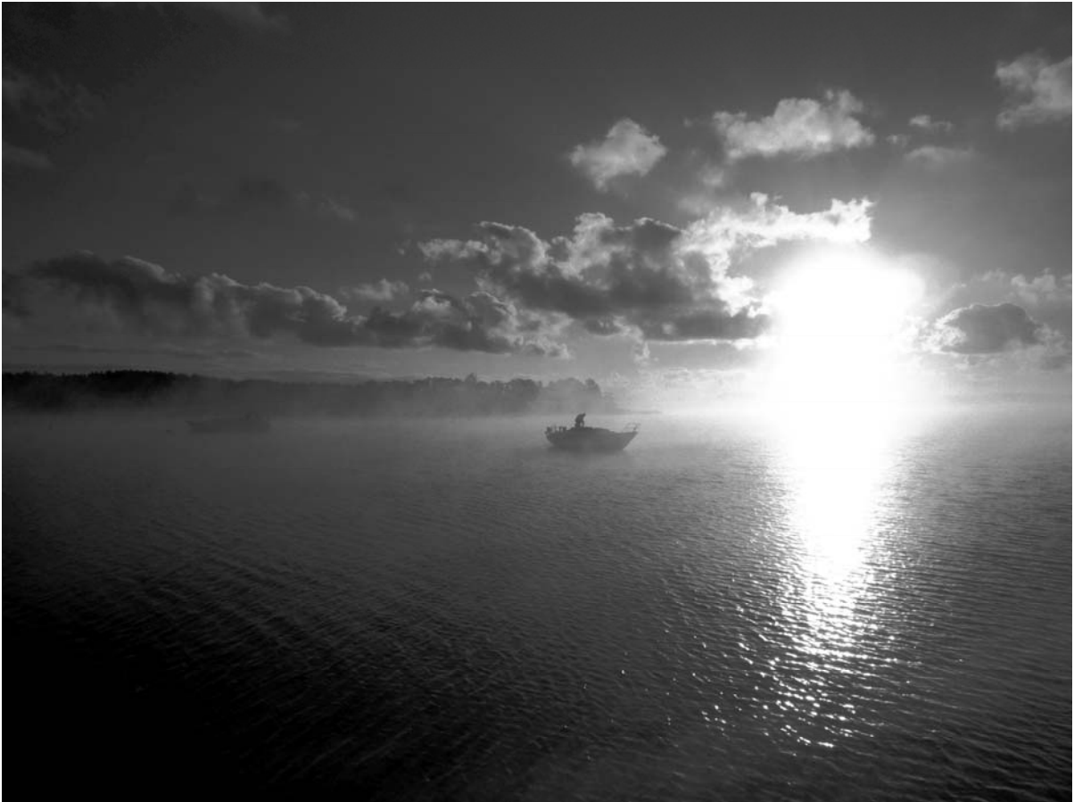
Den första torrsättningsdagen, första passet.