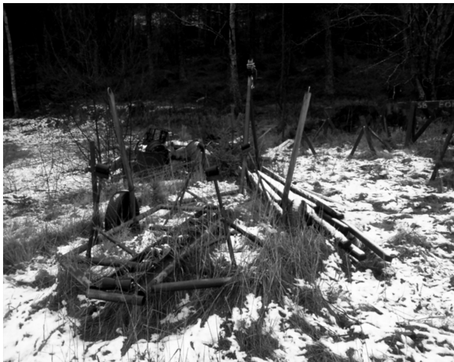
Denna vagga saknar uppgifter om ägare och kommer att anmälas som hittegods till polisen.

I VBS ordningsföreskrifter stadgas: ”Båtägare skall på väl synlig plats ange namn och telefonnummer då båten är uppställd på land. Övrig materiel av privat natur som används för pallning/stöttning/täckning skall när den inte används för avsett ändamål vara väl buntad och märkt med ägarens namn och telefonnummer.”